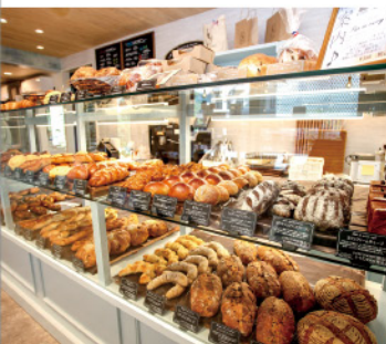
パン・ダニエル Le pain de Daniel