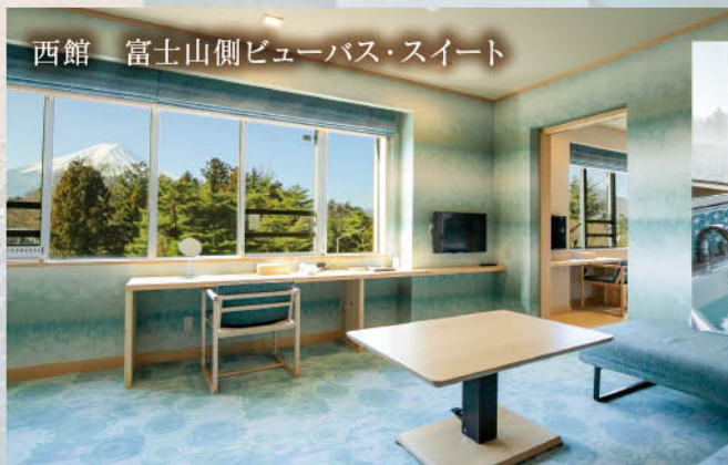
西館 富士山側ビューバス・スイート