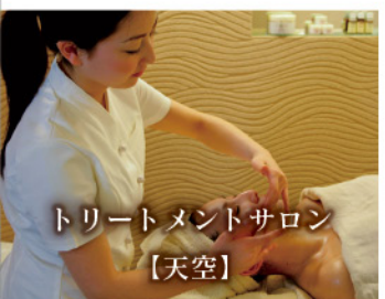
トリートメントサロン 【天空】