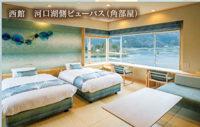
西館 河口湖側ビューバス (角部屋)