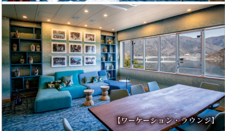
【ワーケーション・ラウンジ】