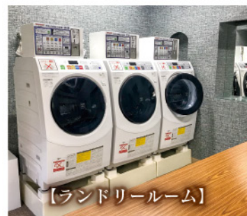
【ランドリールーム】