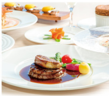
フランス料理レストラン PREMIER