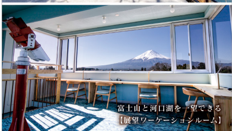
富士山と河口湖を一望できる 【展望ワーケーションルーム】