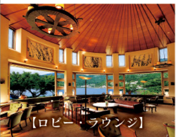
【ロビー・ラウンジ】