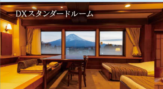
DXスタンダードルーム